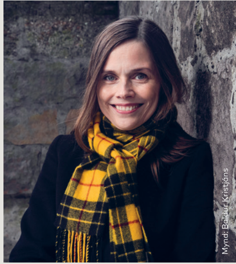
Forsætisráðherra Katrín Jakobsdóttir