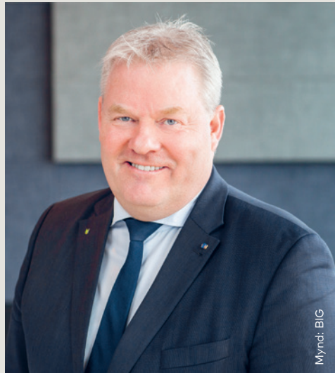
Samstarfsráðherra Norðurlandanna Sigurður Ingi Jóhannsson